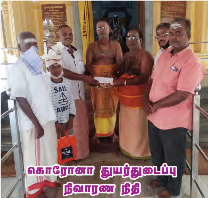
கொரோனா துயர்துடைப்பு நிவாரண நிதி

டி. ஆர். சுந்தரம், இரண்டுமுறை தென்னிந்திய திரைப்பட வர்த்தக சபையின் தலைவராக பணியாற்றியுள்ளார். தமிழ் சினிமாவின் தவிர்க்கவியலாத அடையாளமாகவும், ஏராளமான திரைக்கலைஞர்களுக்கும் தாய் வீடாக விளங்கிய 'மாடர்ன் தியேட்டர்ஸ்' தற்பொழுது நவீன குடியிருப்பு வளாகமாக மாறிவிட்டது. மாடர்ன் தியேட்டரை ஞாபகப்படுத்தும் ஒரே அடையாளமாக 'மாடர்ன் தியேட்டர்ஸ்' என்ற அலங்கார வளைவு மட்டும் இன்றும் மௌன சாட்சியமாக நின்று கொண்டிருக்கிறது.